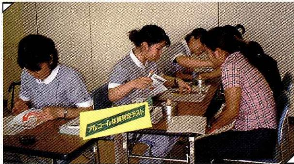
アルコールパッチテスト あなたは飲める派？飲めない派？ 確かめてみませんか？ 多くの人がテストを受けました。