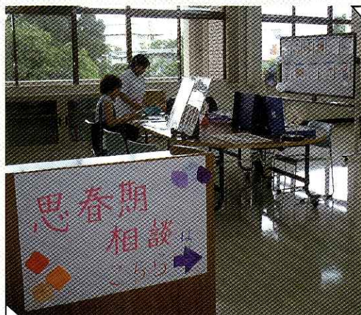
思春期相談 あなたの悩みに答えます！