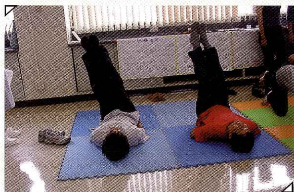
あなたの体力年齢は？ 足先で数字を書いて腹筋力を測る。