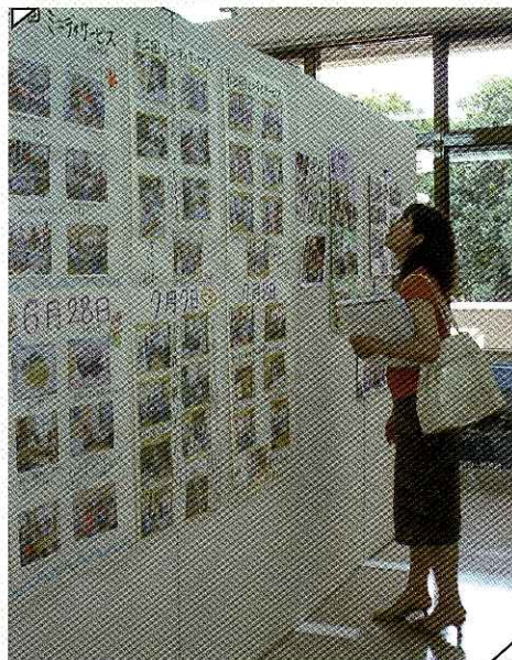
島の研究 教員による出展離島・過疎地域支援事業コーナー