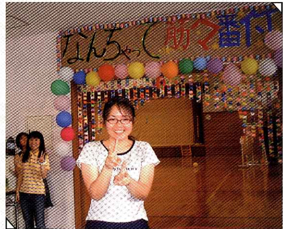
なんちゃって筋々番付 体育館でストレス発散を。