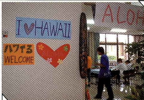
ハワイの？ 参加者によるハワイの再現。