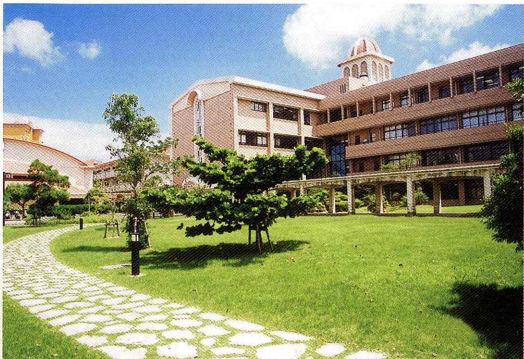
緑が萌ゆる我が学び舎