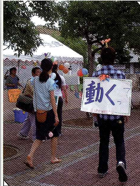
【是非、わがコーナーにお越しください！】 歩く宣伝マン出現